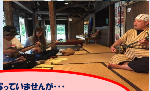
写真には写っていませんが… 山本氏大活躍！！ 初めての三線も上手に弾けました☆