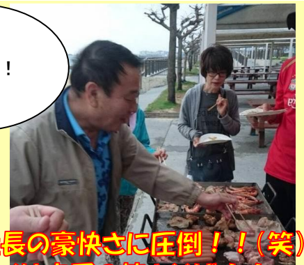
社長の豪快さに圧倒！！(笑) シメは定番の焼きそば！！