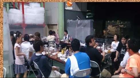
7月のため熱中症気味のBBQです(笑)