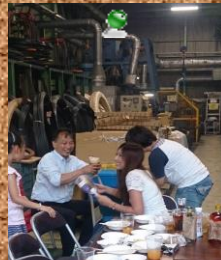
三協レディースチームに囲まれお酒が進む足立工場長☆